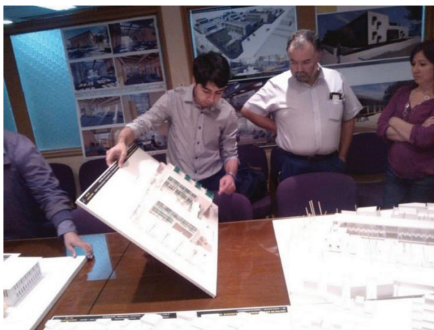
Imagen 6. Estudiante del Taller de Título Mostrando la Maqueta de su Propuesta al Socio Comunitario. Año 2013

Las jornadas de trabajo con el socio comunitario se mantienen con la finalidad de validar las propuestas que se van generando. Con esa nueva perspectiva y con un análisis más maduro y profundo el estudiante plantea y desarrolla lo que será su Proyecto de Título.