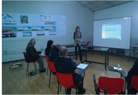
Imagen 8. Examen de Título. Año 2015

La participación del socio comunitario desde el inicio es importante, ya que es quien proporciona la problemática y apoya todo el proceso analítico reflexivo del estudiante desde su perspectiva, intereses y necesidades. De ello, se valora la posibilidad de confrontar perspectivas que no son convergentes, poniendo al estudiante en situación de conflicto y obligándolo a conciliar su propuesta con las necesidades del mandante.