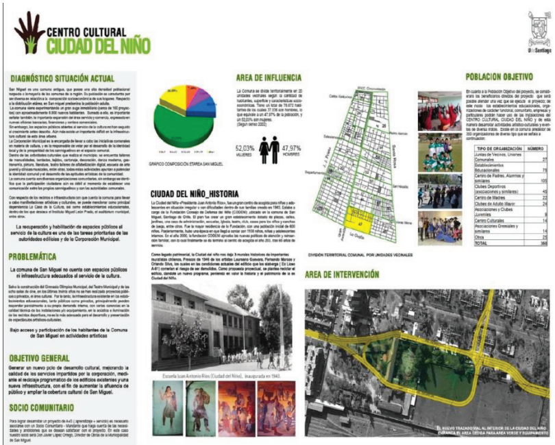
Imagen 7. Lámina del Taller: Proyecto Centro Cultural Ciudad del Niño. Autor: Daniela Valencia, año 2014

Un ejemplo de los proyectos de título elaborados se presenta a continuación (Imagen 7), que dispone de información relativa al diagnóstico, problemática y objetivo propuesto. A su vez, caracteriza el espacio a intervenir señalando factores ambientales, espaciales, sociales, que permiten dar cuenta de una propuesta adecuada al contexto que responda a las necesidades reales del mandante.