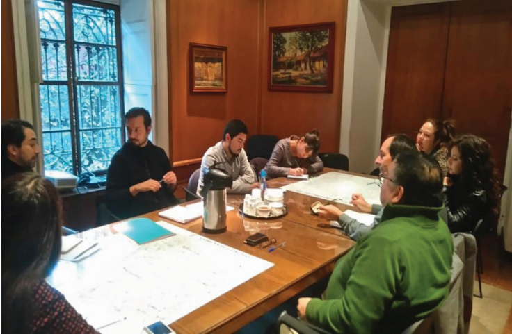
Imagen 5. Reunión de Trabajo con Socio Comunitario (Municipalidad de Conchalí, 2016)

En paralelo, cada estudiante debe profundizar respecto de los requerimientos expresados por el socio comunitario, para lo cual durante el primer semestre se realizan visitas a terreno para levantar información de los usuarios sobre la percepción del uso de los espacios asociados a la problemática. También existen instancias grupales en las cuales se invita al socio comunitario a precisar sus necesidades y lograr una integración más adecuada de las expectativas, deseos y anhelos que tienen del proyecto.