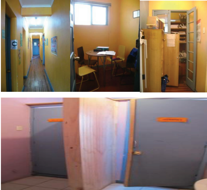
Imagen 4: Espacios no Cumplen Normativa para Funcionalidad (Rucahueche).