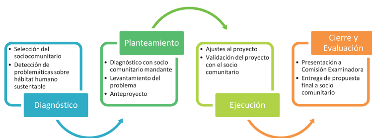
Imagen 3: Etapas para la Realización del Taller de Pase y de Título

Para favorecer la comprensión de la innovación, se organizaron cuatro etapas de ejecución del taller de Pase y Título, bajo la metodología de A+S: